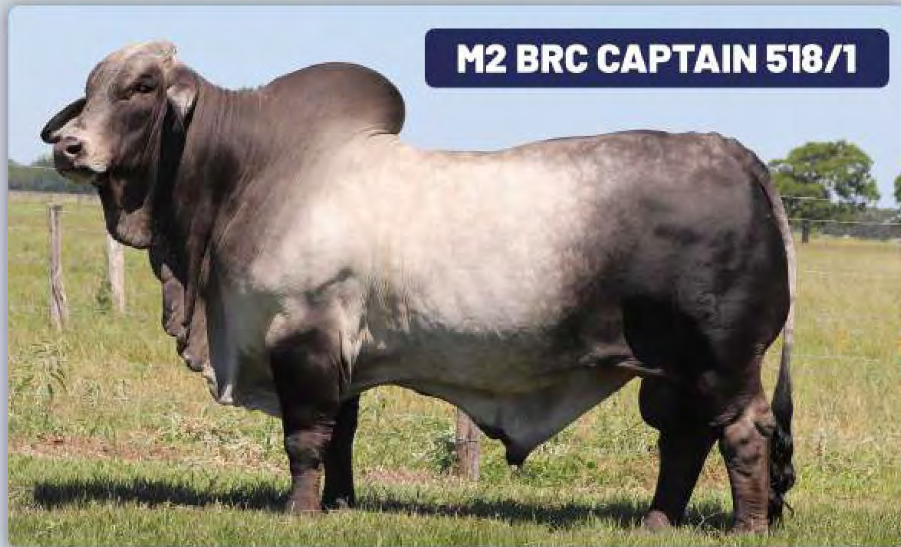
M2 BRC CAPTAIN 518/1

ABBA #: 1003565 Fecha Nac: Enero 2016 Padre: +Mr. V8 191/7 Madre: +BRC 645/6