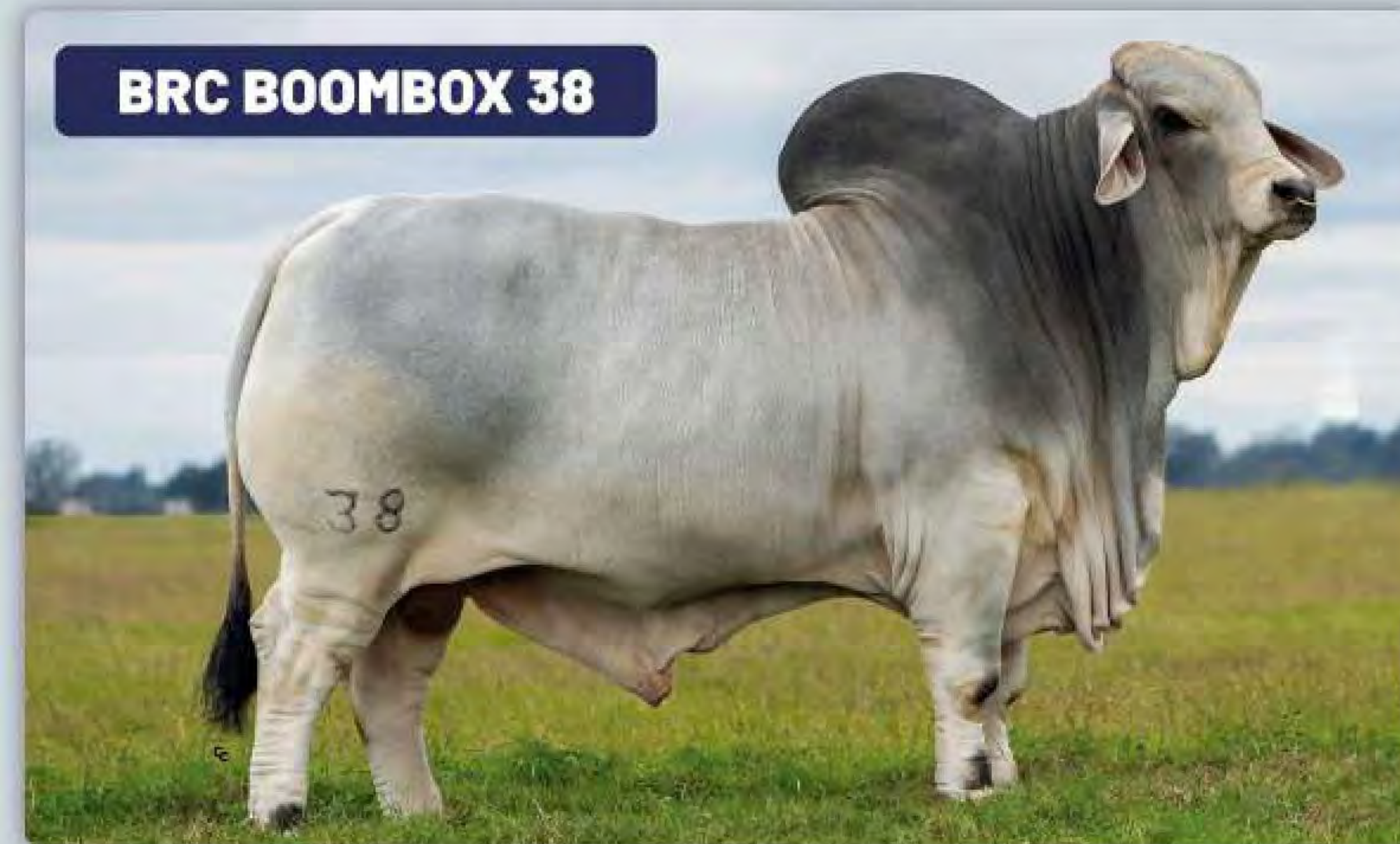
BRC BOOMBOX 38

Dutton es un favorito mundial. Combina el mejor toro de BRC (Noble) y la mejor vaca (Boom Shaka Laka). Estructura moderada, un carácter racial excelente, potencia, rendimiento y una estructura perfecta.