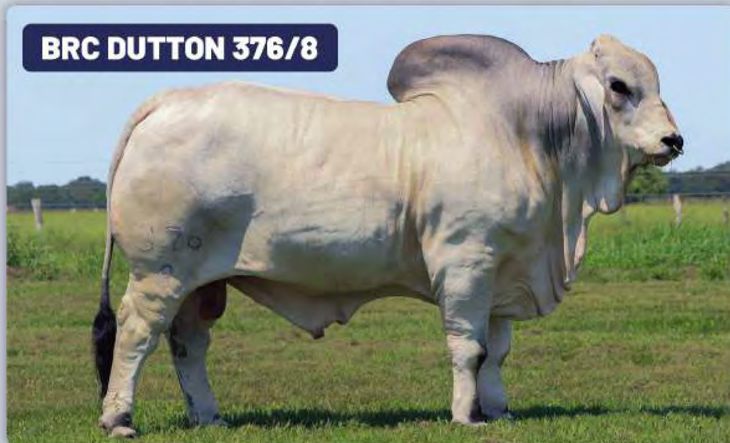
BRC DUTTON 376/8

Por su color rojo intenso, casi negro azabache, es el favorito de muchos en todo el mundo, pero tiene un pedigrí Brahman 100 % gris. Tiene un peso bajo al nacer, es de constitución robusta, con un gran carácter de raza, mucho rendimiento y está respaldado por las mejores líneas de sangre Brahman del mundo, incluida la gran cruce de Noble x 380. Su madre, Miss V8 507/7.