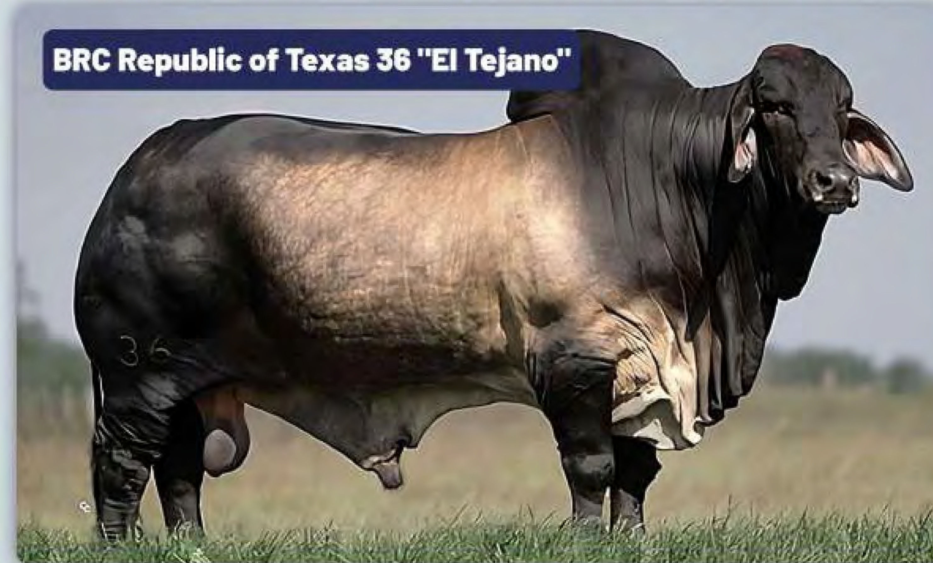
BRC Republic of Texas 36 "El Tejano"

Una leyenda en ascenso por su moderación, musculatura natural y solidez. Se está convirtiendo rápidamente en una opción de referencia para el ganado del mundo real con un fenotipo excelente. Su primera generación de terneros ha producido numerosos campeones tanto en las divisiones de exhibición de toros rojos como grises.